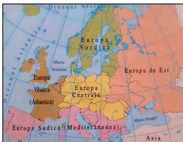
fig. 1 Europa – Grupări regionale de state